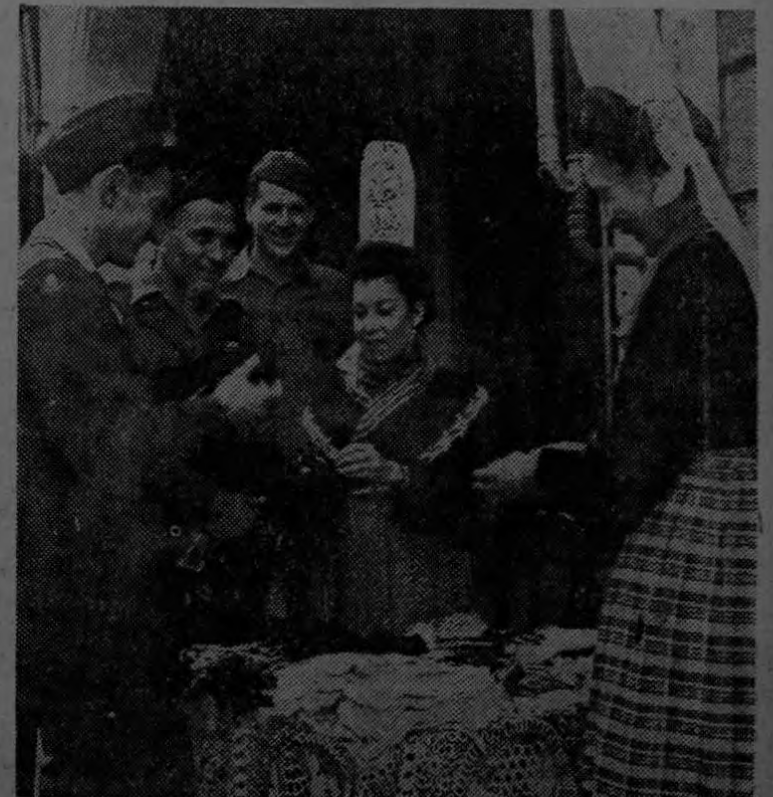
Antes de salir de Francia los G. I. americanos compran a estas bretonas ataviadas con sus pintorescos trajes regionales, guantes y encajes para sus familiares y para sus novias.