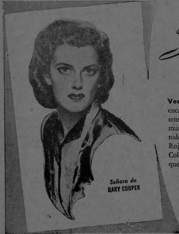
Señora de GARY COOPER